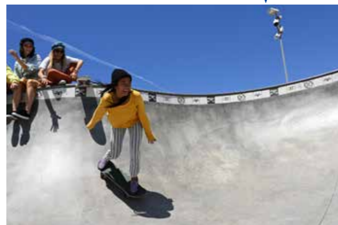
• 机身: Z 50 • 镜头: 尼康 Z DX 16-50mm f/3.5-6.3 VR • 焦距: 19mm • 曝光: [S] 模式, 1/2000秒, f/6.3