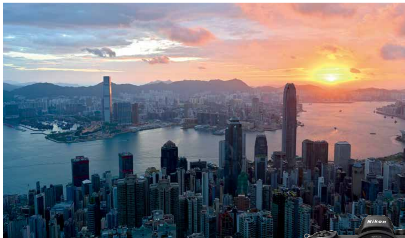
• 机身: Z 7 • 镜头: 尼康 Z 24-70mm f/4 S • 焦距: 28mm • 曝光: [M] 模式, 1/13秒, f/8 • 白平衡: 自然光自动适应 • ISO 感光度: ISO 100

Z 7的核心是具有约4,575万有效像素和焦平面相位检测自动对焦(AF)的FX格式背部入射式CMOS传感器。它充分利用了尼康Z卡口镜头的光学性能,为影像带来良好的清晰度。此外,通过尽可能增加光电二极管中累积的信号量,Z 7利用EXPEED 6的影像处理器实现ISO 64-25600的标准感光度范围(可扩展至相当于ISO 32-102400)。