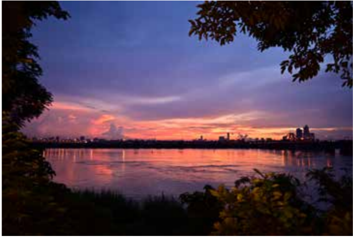
●机身：Z 50 ●镜头：尼克尔 Z DX 16-50mm 1/3.5-6.3 VR ●焦距：16mm ●曝光：【A】模式，1/50秒，f/3.5