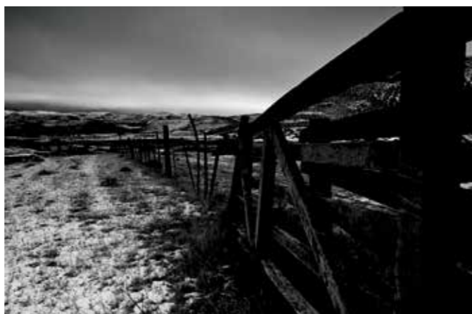
• 机身: Z 7 • 镜头: 尼康 Z 24-70mm f/4 S • 焦距: 26.5mm • 曝光: [M] 模式, 1/25秒, f/20 • ISO 感光度: ISO 500

*当在“高速连拍(延长)”模式下使用12位RAW、JPEG或TIFF时。具有自动对焦(AF)和自动曝光(AE)的约9幅/秒连拍在12位RAW格式时持续拍摄约2.5秒。约5.5幅/秒的高速连拍在拍摄期间几乎能够实时显示拍摄对象的动作。连拍速度取决于图像品质、图像尺寸和静音拍摄设置以及所用存储卡的类型。