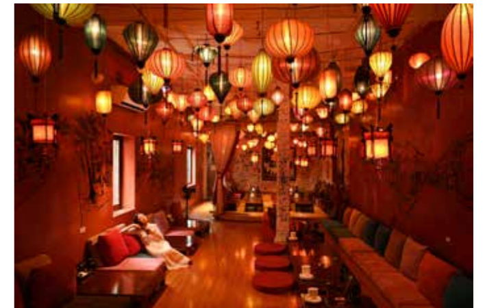
• 机身: Z 50 • 镜头: 尼康 Z DX 16-50mm f/3.5-6.3 VR • 焦距: 16mm • 曝光: [A] 模式, 1/1.6秒, f/5.6 • ISO 感光度: ISO 200

* 使用机械快门、高速连拍 (延长) 模式和 NEF (12 位 RAW) + JPEG 图像品质时。