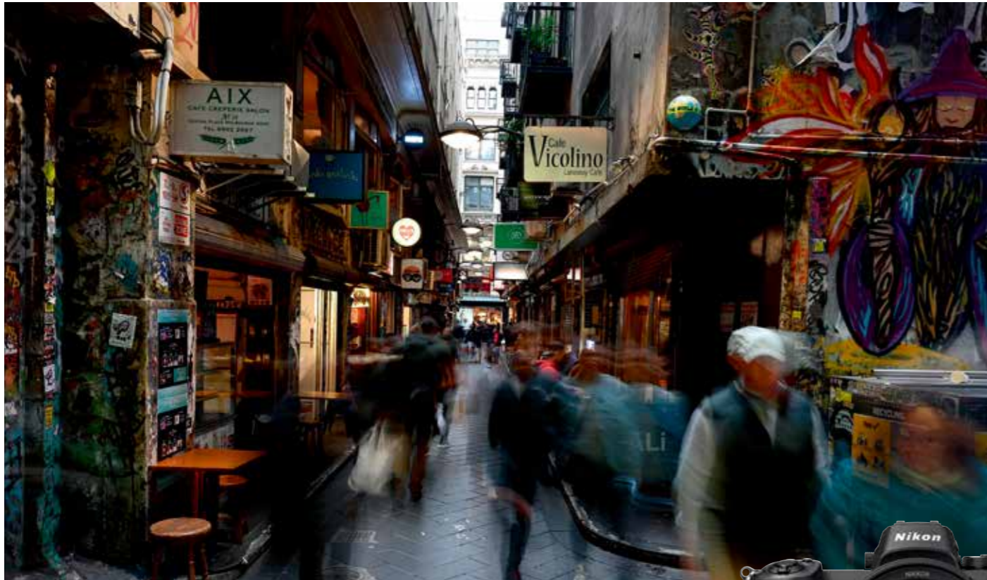
• 机身: Z 6 • 镜头: 尼康 Z 24-70mm f/4 S • 焦距: 24mm • 曝光: [A] 模式, 1/3秒, f/8 • ISO 感光度: ISO 100

为了体验 Z 6 的约 2,450 万有效像素和尼康 Z 卡口镜头的高分辨率所带来的图像品质,清晰的对焦至关重要。Z 6 采用复合自动对焦系统,具有 273 个对焦点 *1 ,覆盖水平和垂直方向各约 90% 的画面覆盖率。利用针对 FX 格式传感器优化的自动对焦算法,可以根据需要使用焦平面相位检测自动对焦 (AF) 或对比检测自动对焦 (AF) 对拍摄对象进行对焦。由于覆盖范围大,还可以对焦于画面边缘的主体,实现更多的创作自由。此外,尼康 Z 卡口镜头的设计旨在满足严格的自动对焦标准,提供高分辨率性能和良好的自动对焦精度。当拍摄低光照场景中的静止图像时,启动相机的低光照自动对焦 (AF) 功能后可将自动对焦测光范围降至 -6EV *2 。