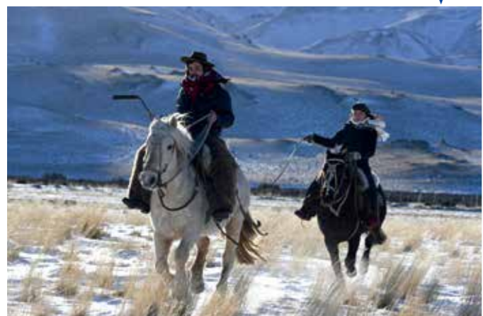
• 机身: Z 7 • 镜头: AF-S 尼康 80-400mm f/4.5-5.6G ED VR + 卡口适配器FTZ • 焦距: 155mm • 曝光: [M] 模式, 1/4000秒, f/8 • 白平衡: 自动1 • ISO 感光度: ISO 1250

焦平面相位检测自动对焦(AF)像素有效地分布在整个传感器中,使其能够在较宽的画面区域中提供准确的自动对焦。同时,传感器的铜线电路可快速读取自动对焦信息和约4,575万有效像素的大量数据,实现约9幅/秒的连拍速度*。