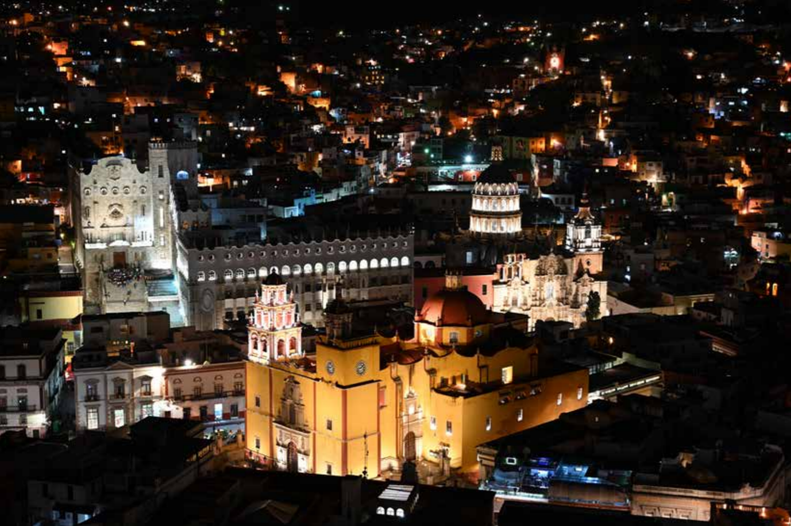
• 机身: Z7 • 镜头: 尼康 Z 24-70mm f/4 S • 曝光: [M] 模式, 1/2秒, f/4 • 白平衡: 自动1 • ISO 感光度: ISO 400 • 优化校准: 标准