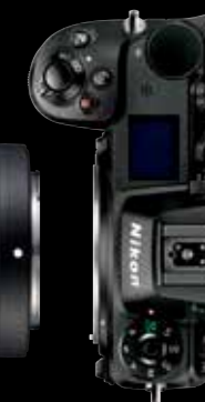
Z7 / Z6