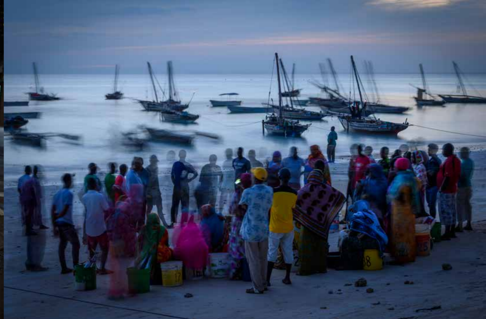
• 机身: Z6 • 镜头: 尼克爾 Z 24-200mm f/4-6.3 VR