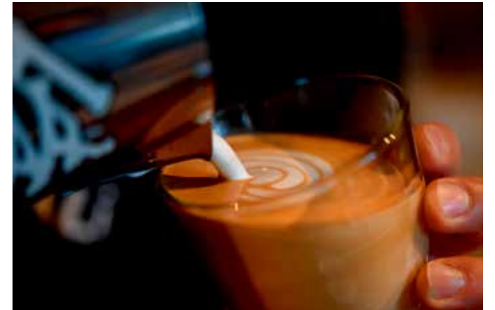
• 机身: Z 6 • 镜头: AF-S 微距尼康 60mm f/2.8G ED+卡口适配器 FTZ • 焦距: 60mm • 曝光: [A] 模式, 1/125秒, f/3.5 • ISO 感光度: 自动