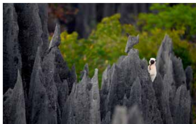
• 机身: Z 7 • 镜头: AF-S 尼康 180-400mm f/4 ETC1.4 FL ED VR (内置1.4倍增距镜) + 卡口适配器FTZ • 曝光: [M] 模式, 1/100秒, f/5.6 • ISO 感光度: ISO 4000