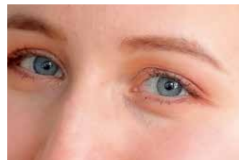
启动眼部侦测自动对焦时的样张。

将焦点对在右边模特的右眼,右边模特的眼部精准合焦。放大直出照片的眼睛,眼睛下方的细纹都清晰保留,睫毛也是丝丝分明。