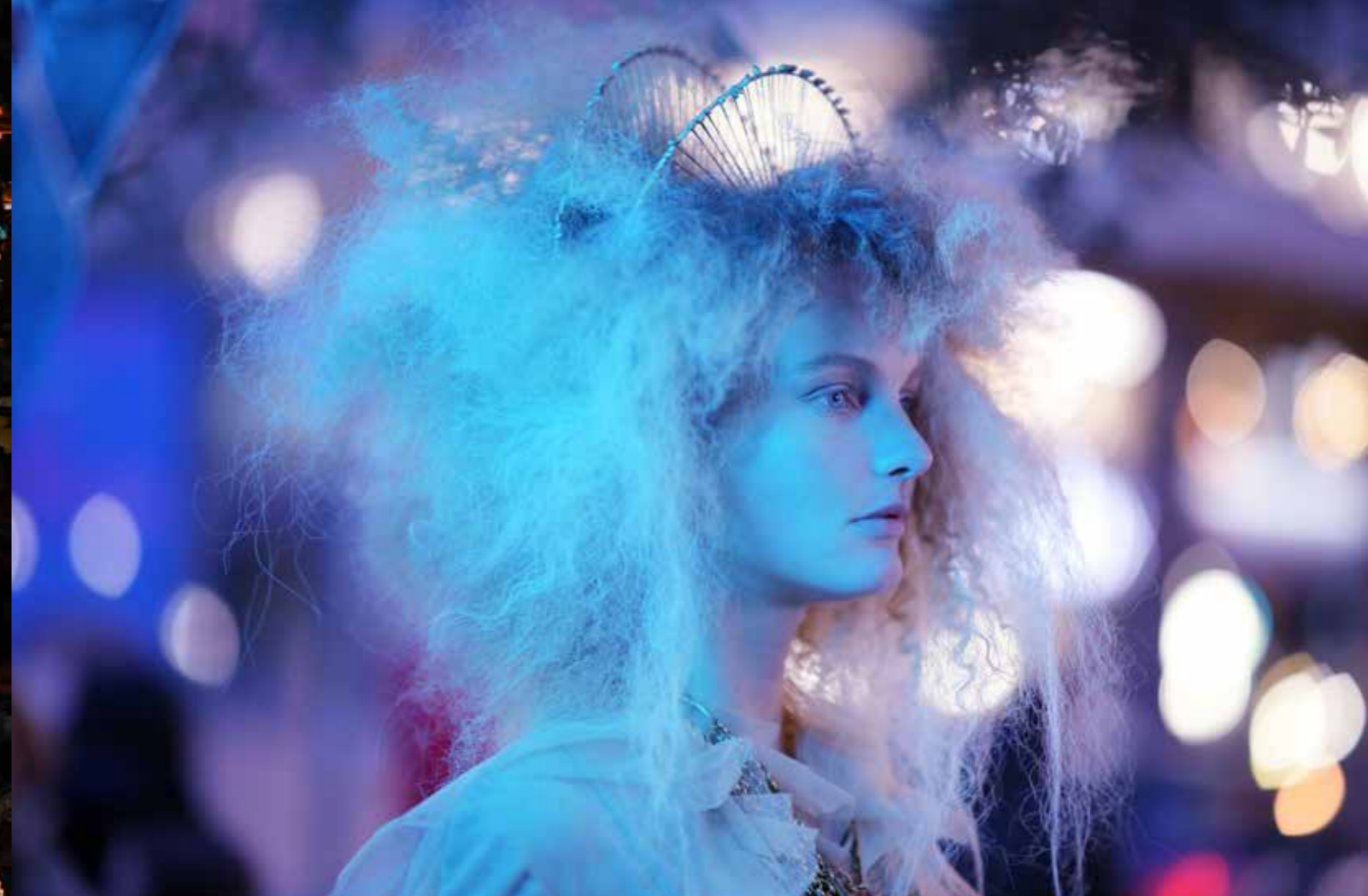
• 机身: Z7 • 镜头: 尼康 Z 58mm f/0.95 S Noct