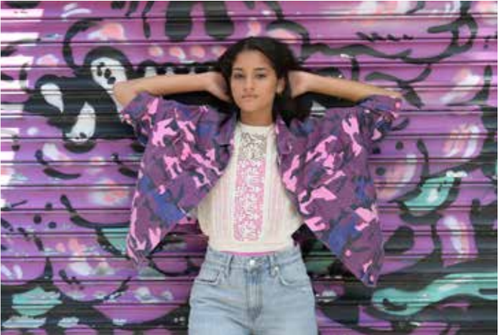
●机身：Z 50 ●镜头：尼克尔 Z DX 50-250mm 1/4.5-6.3 VR ●焦距：50mm ●曝光：【M】模式，1/400秒，f/5.6