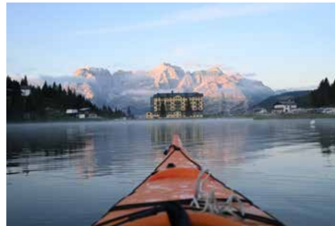
• 机身: Z 50 • 镜头: 尼康 Z DX 16-50mm f/3.5-6.3 VR • 焦距: 24.5mm • 曝光: [M] 模式, 1/400秒, f/4.2 • ISO 感光度: ISO 500