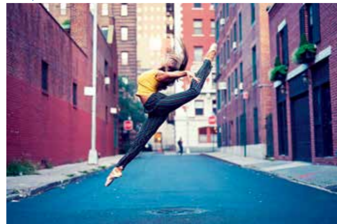
• 机身: Z 6 • 镜头: 尼康 Z 35mm f/1.8 S • 焦距: 35mm • 曝光: [M] 模式, 1/640秒, f/1.8 • 白平衡: 自动 • ISO 感光度: ISO 640