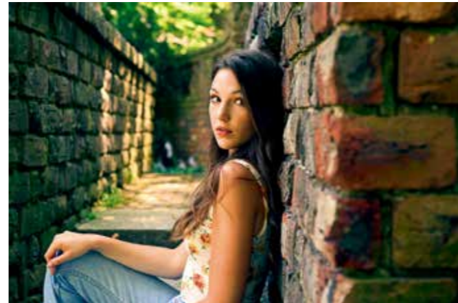
• 机身: Z 6 • 镜头: 尼康 Z 50mm f/1.8 S • 焦距: 50mm • 曝光: [M] 模式, 1/320秒, f/4 • 白平衡: 自动 • ISO 感光度: ISO 800