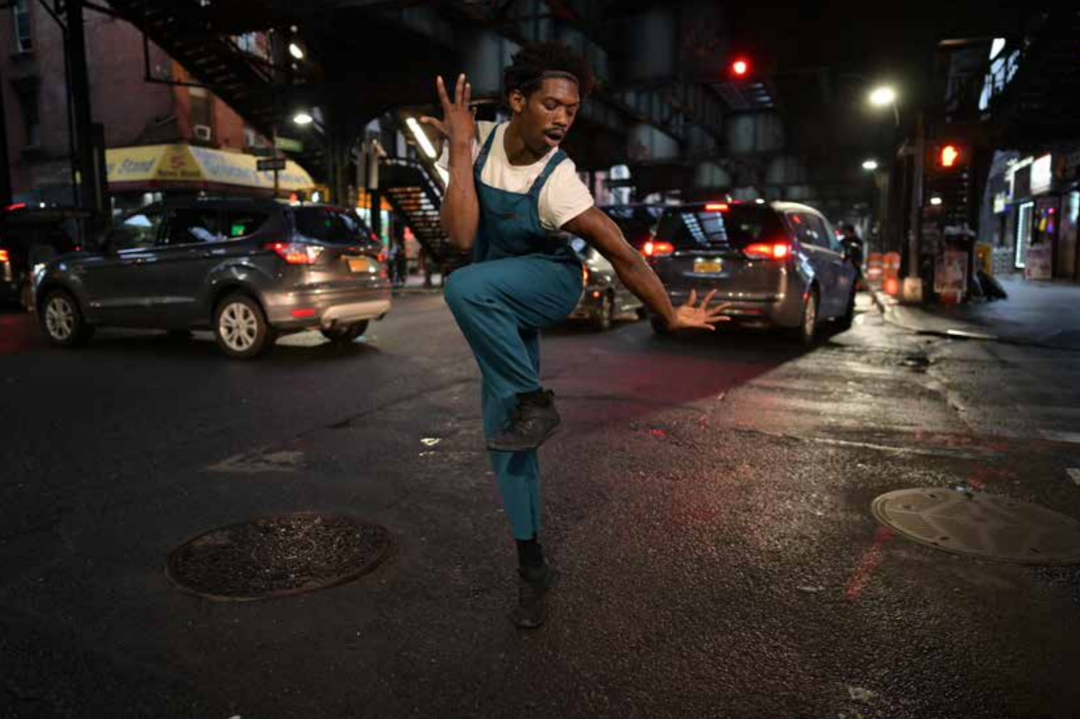
• 机身: Z7 • 镜头: 尼克爾 Z 24mm f/1.8 S • 焦距: 24mm • 曝光: [M] 模式, 1/250秒, f/1.8 • ISO 感光度: ISO 1600